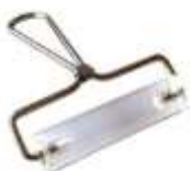
10cm acrylic roller for western blotting